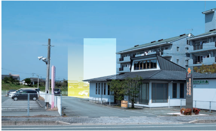
物件建築場所イメージ