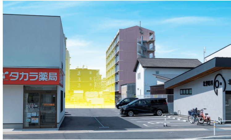
物件建築場所イメージ